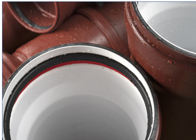
GARNITURĂ DE ETANȘARE