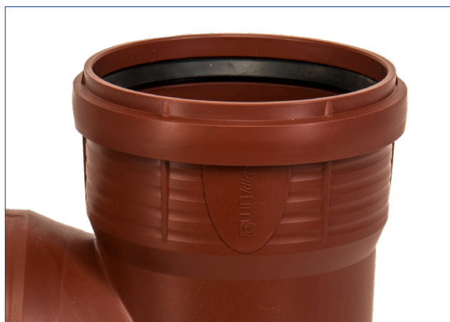
MARCAREA UNGHIULUI PENTRU O INSTALARE MAI UȘOARĂ