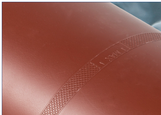
MARCAJ AL ADÂNCIMII DE ÎMBINARE